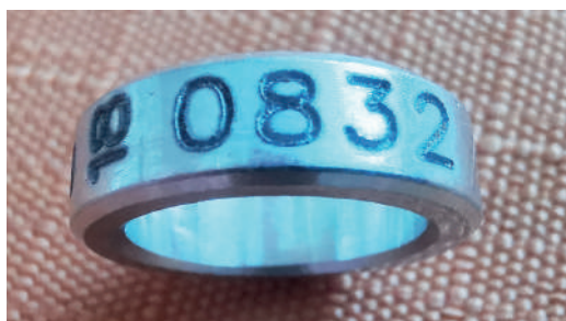
Detail kroužku – pořadové číslo