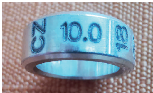
Detail kroužku CZ 10,0 18