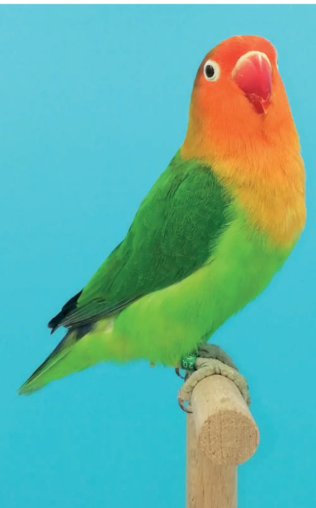
Agapornis fischeri bez žlutého přechodu na hrudi