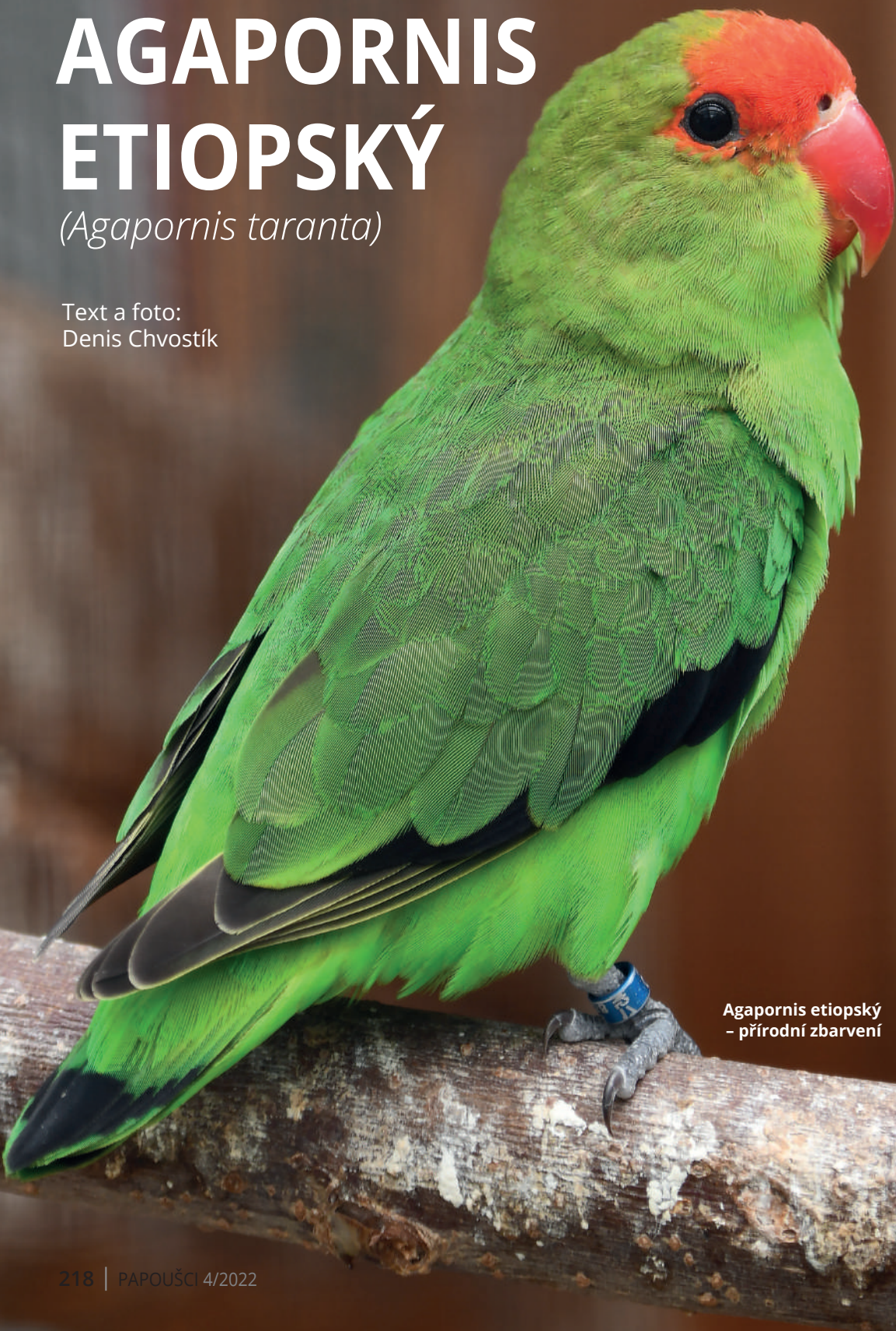
Agapornis etiopský - přírodní zbarvení