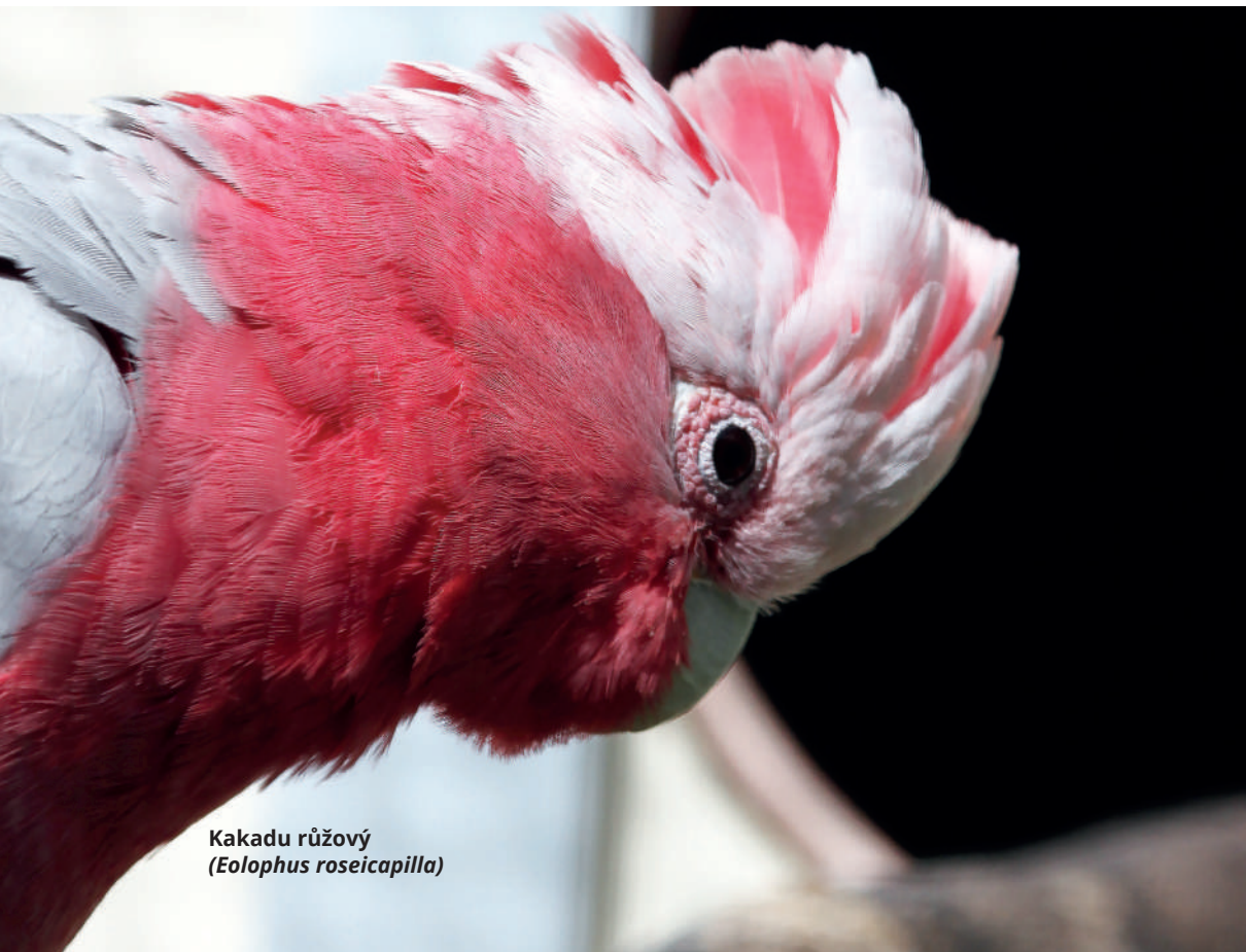
Kakadu růžový ( Eolophus roseicapilla )

Text: Andrea Pokorná • Foto: Alena Winner