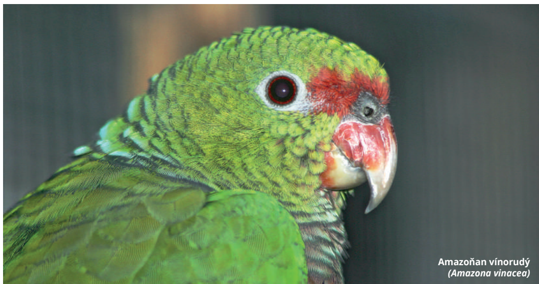
Amazoňan vínorudý ( Amazona vinacea )

Tak jako u lidí, i u papoušků někdy bojujeme s nádory, někdy úspěšně, někdy neúspěšně. Velkým rozdílem v léčbě je fakt, že u papoušků zatím běžně nepoužíváme chemoterapii, případně ji používáme spíše lokálně.